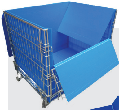
Kreislauf-Container Eine ideale Verkleidung für Gitterboxen für Pendleverkehr