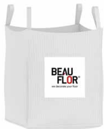
Big bags mis à disposition pour le tri : 97 x 97 x 110 cm